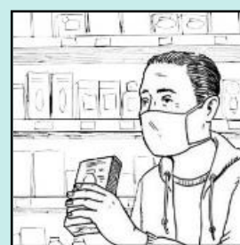
ពាក់ម៉ាស់