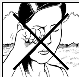
កុំប៉ះពាល់មុខមាត់និង ច្រមុះរបស់អ្នក

ហៅទូរសព្ទលេខ៩១១ បើលោកអ្នកយល់ថា មានរោគសញ្ញាអាសន្ន ពី កូវីដ-១៩