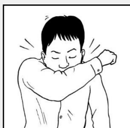
បិទមាត់ពេលក្អក