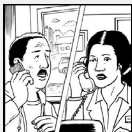
ទូរសព្ទទៅលោកគ្រូពេទ្យមុនពេលទៅជួប