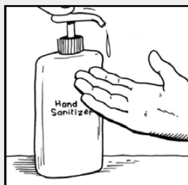
ប្រើអាកុលលាងដៃ