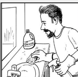
សំអាតផ្ទៃរបស់អ្នកនៅផ្ទះ